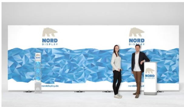
expolinc Fabric gerade