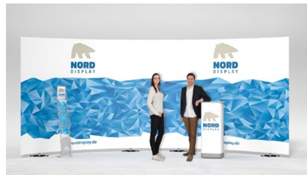
expolinc Fabric gebogen