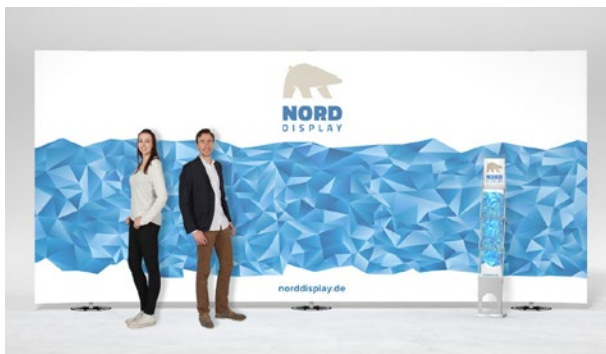
expolinc Fabric innen gerade und außen gebogen