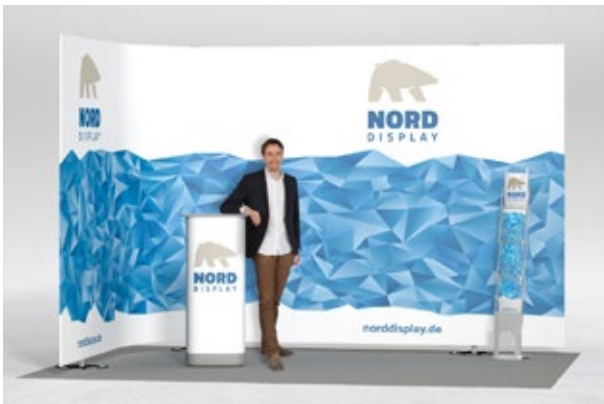
expolinc Fabric Eckstand 4 x 3 m